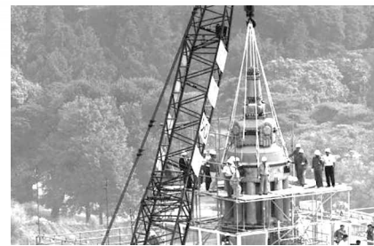
▲ 옛 조선 총독부 건물 철탑 해체

광복 50주년 기념식에서는 '역사 바로 세우기'의 일환으로 옛 조선 총독부 건물의 철탑이 해체되었다. 이날 대통령은 경축사에서 건전한 한일 관계의 구축을 위해 일본의 과거 침략 행위와 식민 지배에 대한 반성이 선행되어야 한다고 강조하였다.